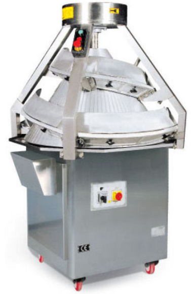
Rampe de boulage réglable

La bouleuse conique KMK est une machine destinée à mettre en boule les pâtons divisés. Elle se place entre une diviseuse automatique et un groupe de pré-fermentation. Le boulage favorise une pré-fermentation et une fermentation régulière.